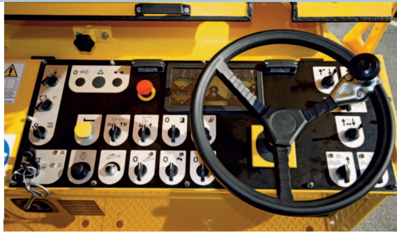
Интуитивная концепция управления.