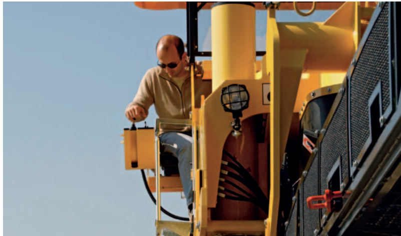
Удобная работа в сидячем положении.