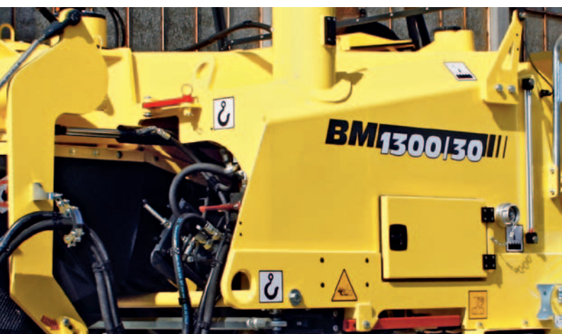
Увеличенный на 25 процентов бак для воды.