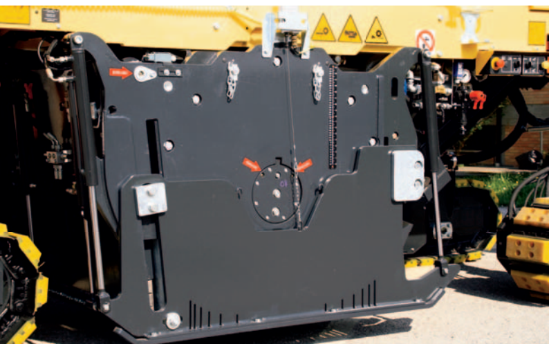
Гидравлические боковые щитки.