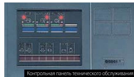
Контрольная панель технического обслуживания

Главная контрольная панель и контрольная панель технического обслуживания (EDIMOS II) удобно расположены на приборном щитке для обеспечения быстрого и ясного слежения за работой машины в любое время. Главная контрольная панель имеет также диагностическую функцию