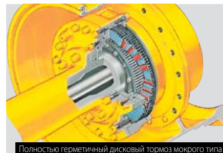
Полностью герметичный дисковый тормоз мокрого типа

Рабочие тормоза: дисковые мокрого типа, с гидравлическим приводом, двухконтурные для обеспечения большей безопасности, не требующие регулировки, полностью герметичные, предотвращающие попадание в них грязи и пыли. Поскольку в этой тормозной системе не используется воздух, она создает ряд преимуществ, таких как отсутствие конденсата, надежное торможение даже в холодных условиях, отсутствие необходимости дренажа, использование нержавеющей гидравлических трубопроводов. Время действия тормозной системы после запуска двигателя радикально сокращено и прилагаемое усилие к тормозной педали снижено.